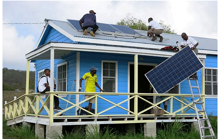
Le projet pilote d'énergie solaire communautaire de l'Association d'Antigua-et-Barbuda pour les personnes handicapées

Le Centre de solutions offre l'apprentissage et la formation entre pairs par le biais de webinaires, vidéos et d'autres ressources. Le Centre de solutions collabore avec des experts et des organisations à l'échelle mondiale pour partager divers points de vue et perspectives par le biais de webinaires avec des séances