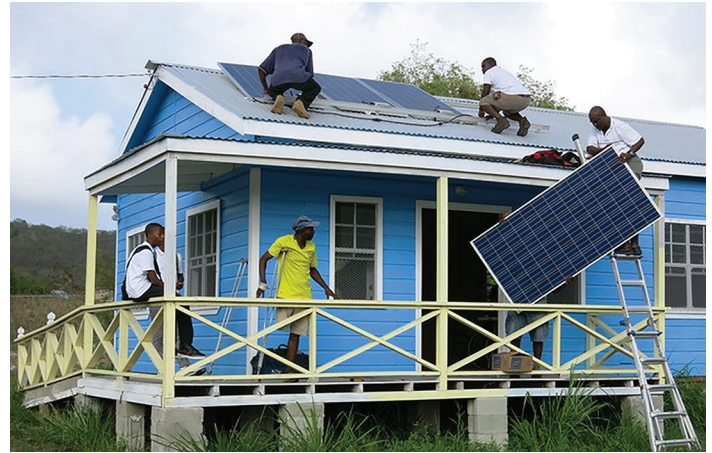
安提瓜巴布达残疾人协会社区太阳能区演示项目

解决方案中心允许用户访问与清洁能源政策最相关和最新的报告、数据和分析工具，提供数千项技术资源。解决方案中心为公务繁忙的政策制定者和分析师精选最权威、最客观、最相关的资源和文章。