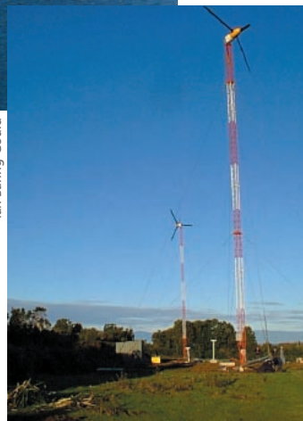
El sistema de energía de La isla Tac provee energía a las 82 familias de la Isla.

diesel-eólico con almacenamiento en baterías sería rentable para suministrar la energía requerida por la isla. La capacidad de análisis sensible de HOMER ayudó al equipo a evaluar los impactos de precio del combustible en el diseño del sistema de costo-mínimo.