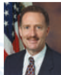
David K. Garman Subsecretario

“En busca de un futuro próspero donde la energía sea limpia, abundante, confiable, y de precio razonable...”