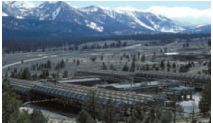
PIX05933 Sandia National Laboratories

La planta geotérmica Mammoth Pacific (en el norte de California) incluye condensadores de enfriamiento de aire a cada lado de los generadores de la planta, en el centro.