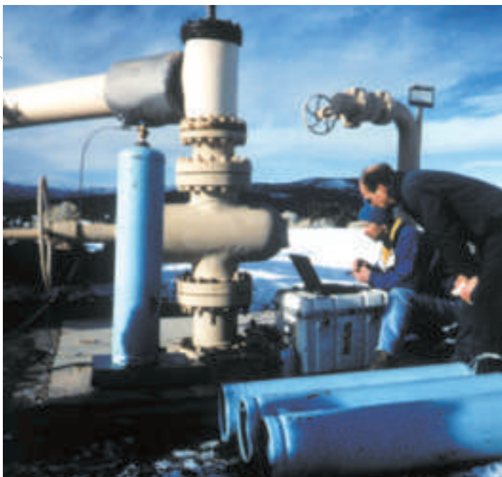
Investigadores en Geociencia llevando a cabo ensayos rastreadores en The Geysers, al norte de California.